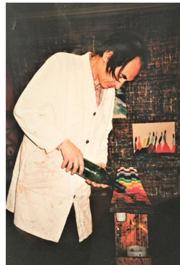
Arno Stern in seinem «Closlieu» in Paris, 1993